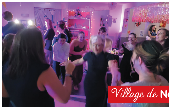
Village de Nancy

Le traditionnel marché de Noël du village a lancé les festivités de cet arbre de Noël ! Chocolat chaud, crêpes, sucettes au chocolat et cookies : nos petits gourmands étaient ravis ! La journée s'est poursuivie avec un karaoké, des blind test et une surprise pour nos jeunes : un flash-mob de l'équipe éducative qui s'était déguisée sur le thème du film Le père Noël est une ordure . Hilarant !