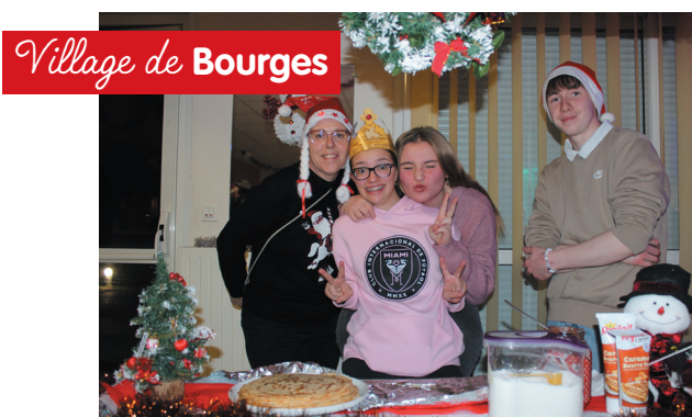
Village de Bourges

Ateliers créatifs en tout genre, décorations scintillantes, repas de fête délicieux et animations inoubliables telles que blind test, pêche aux cadeaux et danse... Ce Noël restera dans les mémoires ! La présence du père Noël a ajouté une touche de magie à l'événement.