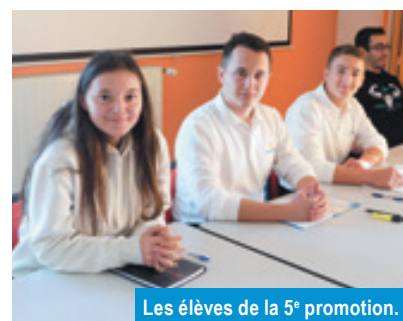
Les élèves de la 5 e promotion.

• Parmi ces 15 candidats, 12 ont suivi la formation dans son intégralité, 5 ont réussi le concours de gardien de la paix et 2 celui de policier adjoint.